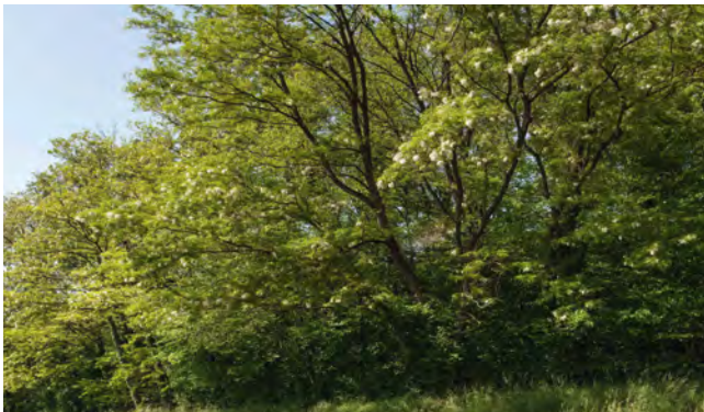
Forêts de robiniers