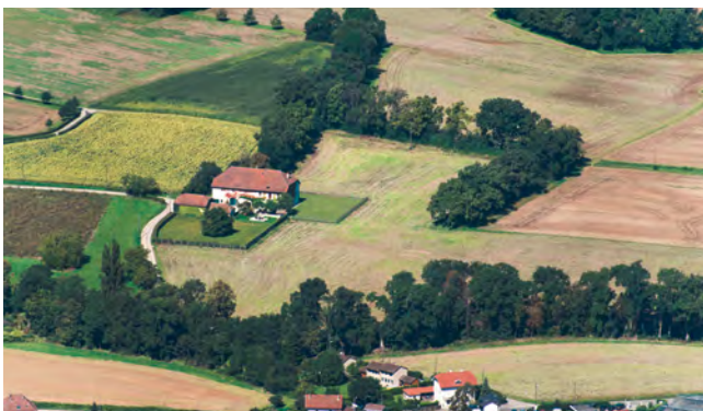
Cordons d'espèces ligneuses